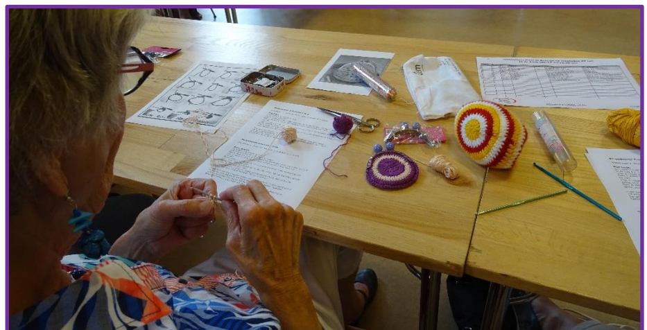
Er is veel belangstelling voor de creatieve activiteiten tijdens de Zomerschool.

Een middagje 'kunst kijken' is een mooie activiteit voor iedereen die weleens twijfelt of die wel of niet aan een creatieve activiteit moet beginnen. Op vrijdagmiddag 29 juli stap je binnen bij 'De Slinger', waar allerlei kunstwerken die ►