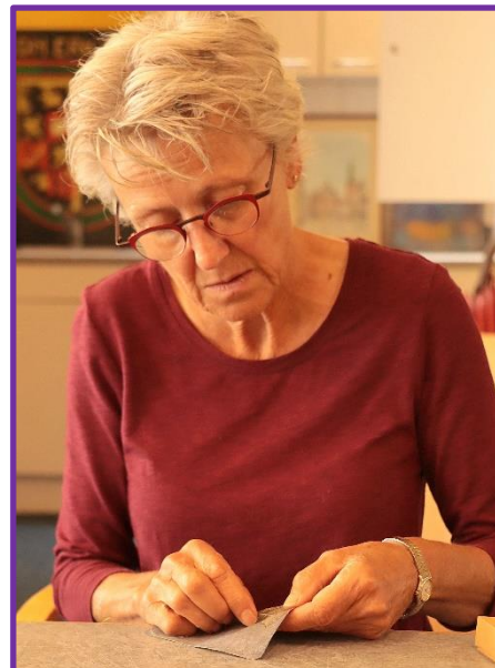
Twee deelnemers aan de cursus 'Boekbinden en kartonnage' op maandagmorgen in 'De Slinger'.

ken met de cursus is door de workshop boekbinden-kartonnage te volgen. Dat kan nog op maandagmiddag 1 augustus in wijkgebouw 'De Slinger' in De Muntel. Je maakt met bedrukt papier en linnen een leporello-mapje of -boekje met een harde kaft. Gewoon een heel mooi cadeau om iets kleins in te bewaren of om een bankbiljet in te geven. Aanmelden kan via: www.saszomerschool.nl