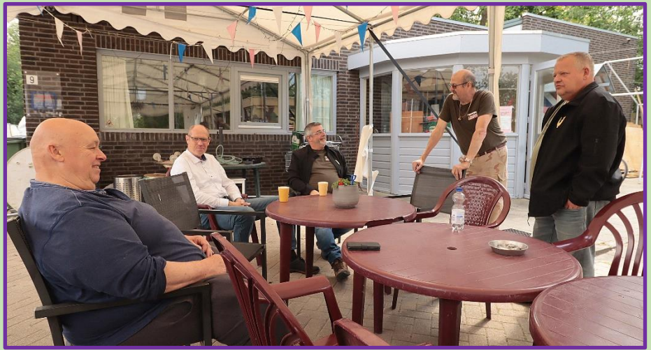
De veteranen ontmoeten elkaar bijna dagelijks voor een praatje bij het VOC Den Bosch. Of gewoon om de krant te lezen en koffie te drinken.